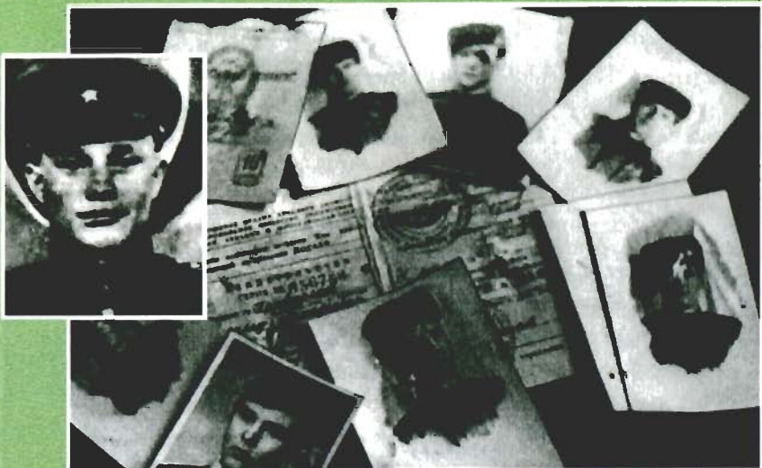
Пограничники, погибшие на о. Даманском 2 марта 1969 года