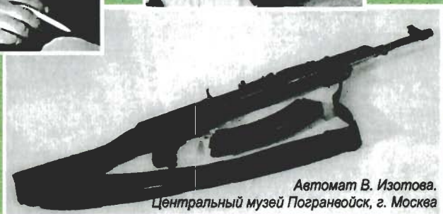
Автомат В. Изотова. Центральный музей Погранвойск, г. Москва